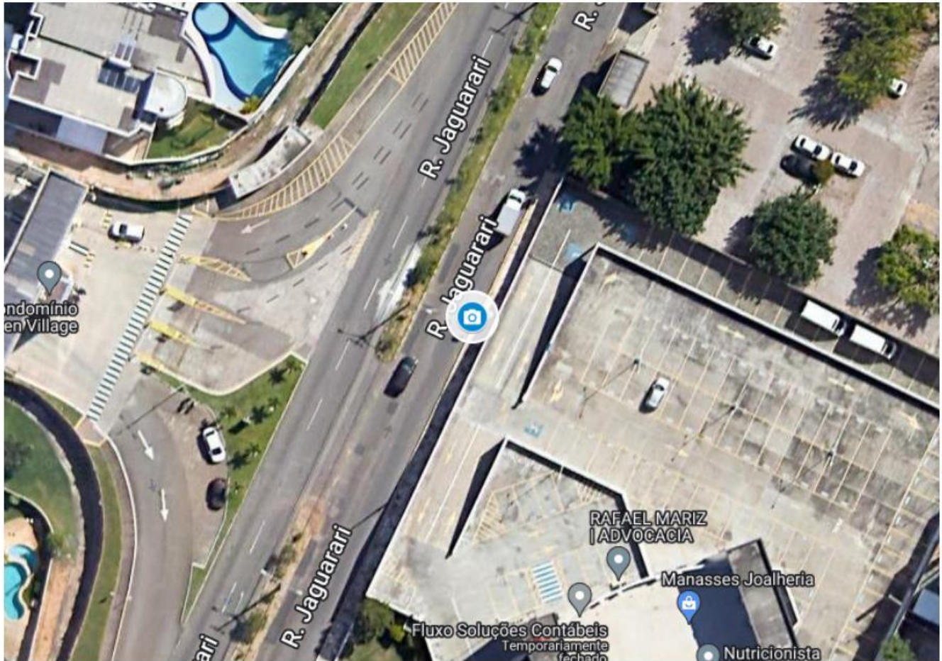
Figura 1 - Vista Superior – Fonte: Google Earth