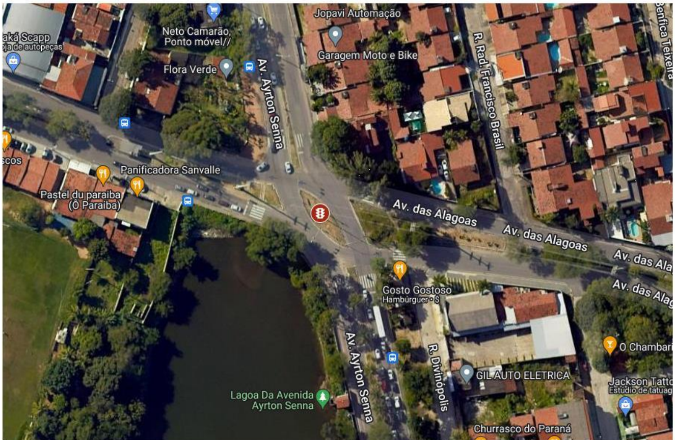
Figura 1 - Vista Superior